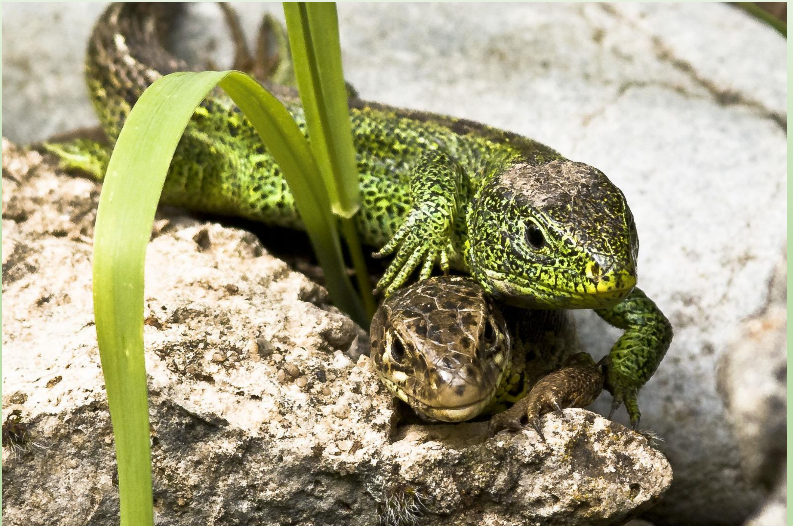
Zauneidechsen weiblich und männlich